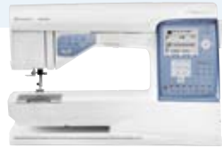
SAPHIRE™ 875 QUILT