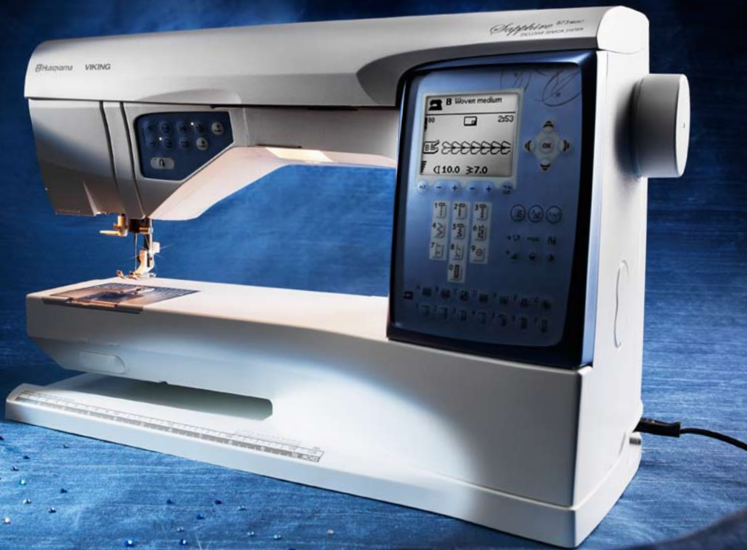
Sapphire™ 875 Quilt