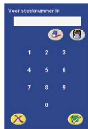
Ga naar borduursteeknummer

In sommige borduurmotieven die u koopt kunnen afsnij-opdrachten staan. Om dit te controleren, kunt u in Stitch Editor kijken of het symbool voor de afsnij-opdracht in het motief staat of kunt u de motieven borduren.