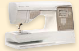
DESIGNER TOPAZ™ 30 DESIGNER TOPAZ™ 20