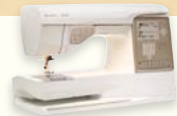
DESIGNER TOPAZ™ 30